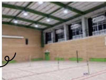
体育室は冷暖房設備も完備！ LED電気で明るくなりました