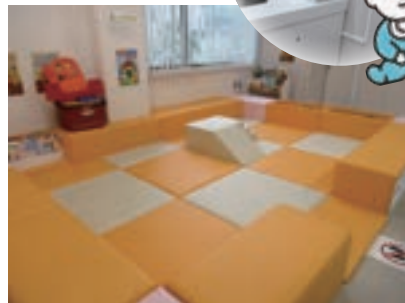
新・キッズスペース