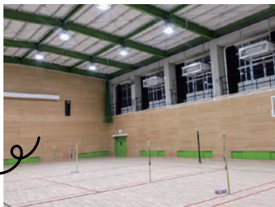
体育室は冷暖房設備も完備！LED電気で明るくなりました