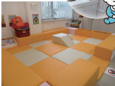
新・キッズスペース